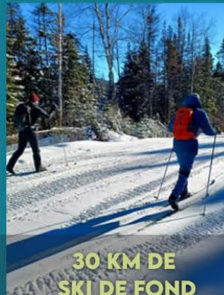
30 KM DE SKI DE FOND