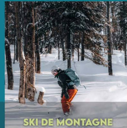
SKI DE MONTAGNE