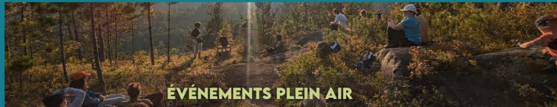
ÉVÈNEMENTS PLEIN AIR

SECTEUR DU MASSIF 2007 CH DU MASSIF, NOTRE-DAME-DE-LA-MERCI 819-424-1865