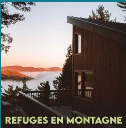
REFUGES EN MONTAGNE