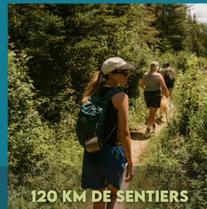
120 KM DE SENTIERS