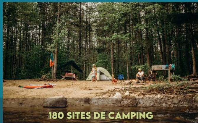
180 SITES DE CAMPING